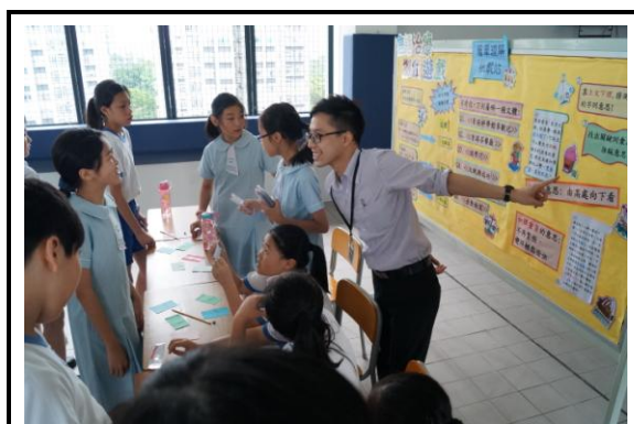
學生踴躍參與攤位遊戲

配合篇章理解的主題，言語治療師分別為高年級(P4-P6)及低年級(P1-P3)設計「篇章理解挑戰站-高階篇」及「篇章理解挑戰站-初階篇」展板。高年級展板攤位遊戲於6月15日小息時段舉行，學生反應熱烈，共有194人次參與遊戲並能正確回答有關攤位內容的問題。低年級展板攤位遊戲配合學校喜閱寫意日，於6月23日課堂及小息時段舉行，共有330人次參與遊戲並能正確回答有關攤位內容的問題。小小治療師負責協助高年級及低年級的攤位遊戲。