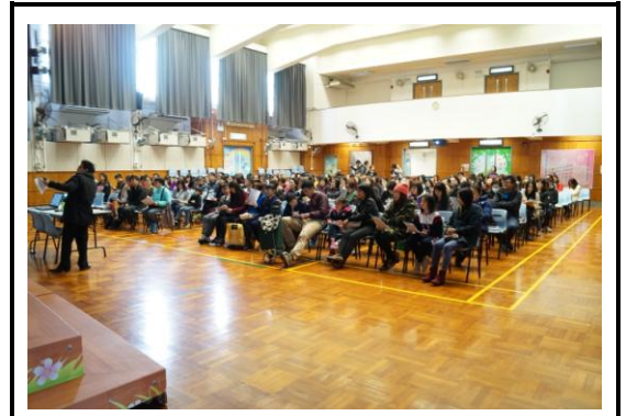
家長工作坊—「篇章理解有辦法」

家長工作坊於 2016 年 1 月 30 日進行，主題為「篇章理解有辦法」，內容環繞提升閱讀理解及聆聽理解的方法及策略，強化學生的理解能力，時間為 60 分鐘。當天有 152 位家長出席並交回問卷，94.7%(144/152)家長表示加深了對篇章理解策略的認識，另有家長認為此工作坊於考試前舉行會更合適。