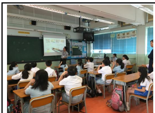
3B 班協作教學—「四格故事」

本學年於 2016 年 4 月 27 日與 3B 班的中文科教師進行一節共同授課，教學主題為「四格故事」，強化學生於敘事中運用連接詞及形容詞。檢討問卷中，教師表示課堂協作加強了學生的敘事技巧，而且學生積極地參與課堂活動。有關課堂協作的教材已給予其他班別的教師作參考。