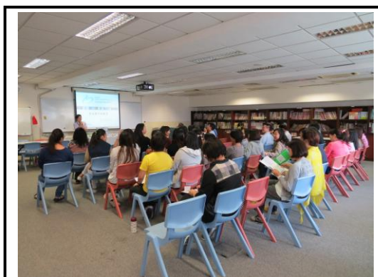
教師講座—「趕走懶音無難度」

本學年於 2015 年 10 月 16 日為全校教師舉行一次教師講座，主題為「趕走懶音無難度」，向教師介紹常見的懶音問題及處理方法。當天有 45 位教師出席並交回問卷，97.8%(45/46) 教師表示講座加深自己對懶音問題及處理方法的認識，另有教師認為講座可以加入真實學生個案研究。