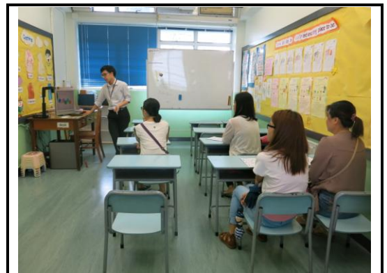
故事姨姨學習說故事技巧

配合學校圖書館主任的活動計劃，言語治療師於 2015 年 10 月期間與 5 位家長義工分享說故事技巧，其後家長義工於課外活動時段在低年級說故事。活動過後，100%(5/5)家長義工表示自己能掌握基本的說故事技巧。