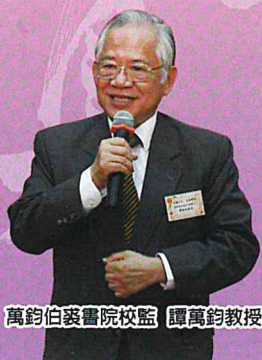
萬鈞伯裘書院校監 譚萬鈞教授